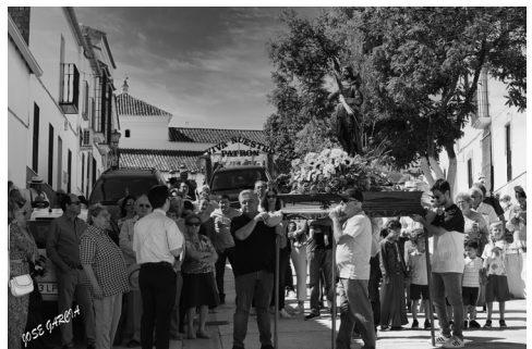
San Isidro 2023