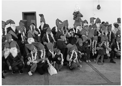
Cabalgata de Reyes 2023