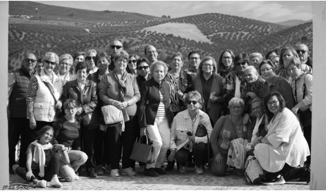
Viaje a Priego 2022